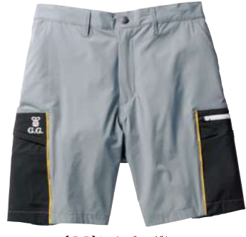
(22)シルバーグレー 0368-07 ハーフパンツ(ノータック、脇ゴム) ¥6,200 (税込 ¥6,820) ナイロン90%・ポリウレタン 10% S~4L