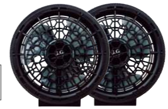
(4)ブラック ファン/16111 ■直径(ウェア取付部分): 90mm ■重量: 約95g (ファン1個) ■3枚羽

デバイスセット オープンブライス セット内容 ファン2個・ファンケーブル1本 バッテリー1個・ACアダプター1個 USBケーブル1本・取扱説明書1通