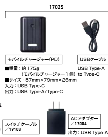
17025 モバイルチャージャー(PD) ■重量: 約 175g (モバイルチャージャー1個) ■サイズ: 57mm×79mm×26mm 入力: USB Type-C 出力: USB Type-A/Type-C USBケーブル USB Type-A to Type-C 17004 ACアダプター 出力: USB Type-A