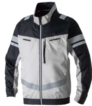
(22)シルバーグレー 7369-10 長袖EFブルゾン(反射材付) オープンブライス ポリエステル 100% S~5L・6L・8L