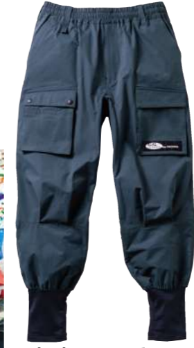
(23)チャコールグレー