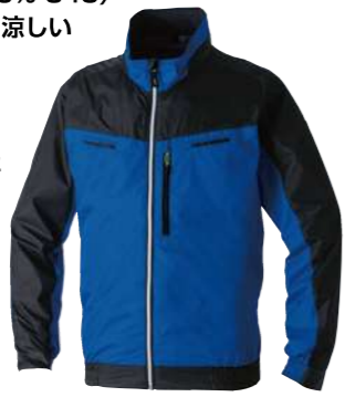
(8)ブルー 7369-00 長袖EFブルゾン オープンブライス ポリエステル 100% S~5L・6L・8L