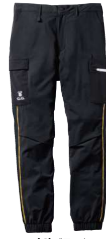
(4)ブラック 0368-08 ジョガーパンツ(ノータック、脇ゴム) ¥8,000 (税込 ¥8,800) ナイロン90%・ポリウレタン 10% S~4L