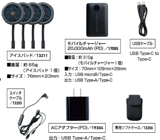
13211 アイスパッド ■重量: 約 65g (アイスパッド1個) ■サイズ: 76mm×23mm 17055 モバイルチャージャー 20,000mAh (PD) / 17055 ■重量: 約 310g (モバイルチャージャー1個) ■サイズ: 70mm×109mm×29mm 入力: USB microB/Type-C 出力: USB Type-A/Type-C USBケーブル USB Type-C to Type-C 19304 ACアダプター(PD) / 19304 出力: USB Type-A/Type-C 13206 専用ソフトケース / 13206