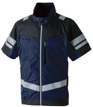
(1)ネイビー 7369-11 半袖EFブルゾン(反射材付) オープンブライス ポリエステル 100% S~5L・6L・8L