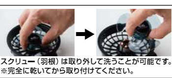
スクリーン(羽根)は取り外して洗うことが可能です。 ※完全に乾いてから取り付けてください。