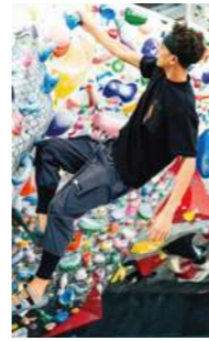
7378-07 ジョガーパンツ(ノータック) ¥8,000 (税込 ¥8,800) 本体: ポリエステル 100% 別布: ナイロン82%・ポリウレタン 18% S~4L Color / (全3色) (4)ブラック (23)チャコールグレー (82)アーミー