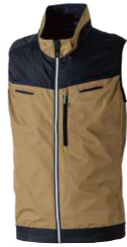
(87)ライトブラウン 7369-06 EFベスト オープンブライス ポリエステル 100% S~5L・6L・8L