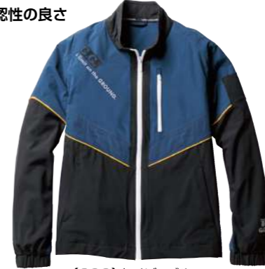
(200)ネイビーブルー 0368-00 長袖ブルゾン ¥9,000 (税込 ¥9,900) ナイロン90%・ポリウレタン 10% S~4L