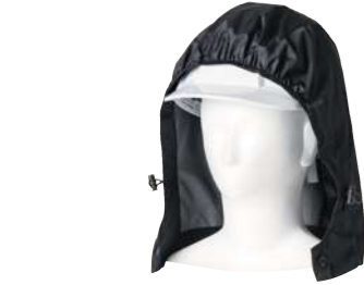
(4)ブラック 7369-90 フード オープンブライス Color / (全1色) ポリエステル 100% F・XL

7369-00・7369-01・7369-06・7369-10・7369-11・7369-16共通 Color / (全4色) (1)ネイビー (22)シルバーグレー (8)ブルー (87)ライトブラウン ※配色は全てブラックです