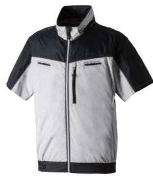
(22)シルバーグレー 7369-01 半袖EFブルゾン オープンブライス ポリエステル 100% S~5L・6L・8L