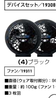
(4)ブラック ファン/19311 ■直径(ウェア取付部分): 90mm ■重量: 約 100g (ファン1個) ■3枚羽