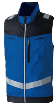
(8)ブルー 7369-16 EFベスト(反射材付) オープンブライス ポリエステル 100% S~5L・6L・8L