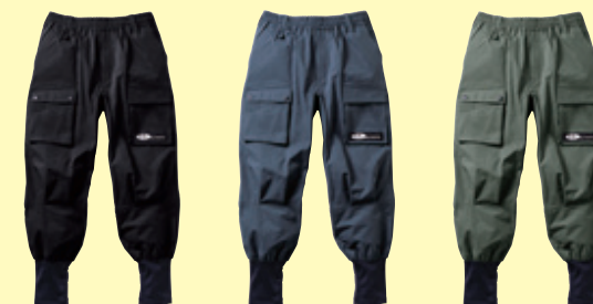
(4) ブラック (23) チャコールグレー (82) アーミー

❗ 3L以上は価格が変わります。(P3参照)、ポリエステル入り製品取扱上のご注意 (P2参照)