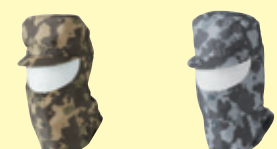
(510) カモフラグリーン (511) カモフラグレー

10092 溶接帽子(ツバ有り) ¥2,300 (税込 ¥2,530) 素 材：綿 100% サイズ：M～LL