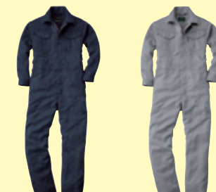
(1) ネイビー (22) シルバークレー

❗ 91cm以上は価格が変わります。(P3参照) ポリエステル入り製品取扱上のご注意 (P2参照) 綿PU製品取扱上のご注意 (P2参照) ■製品洗い加工を施しているため、製品によって、色・サイズのパラつきがございます。