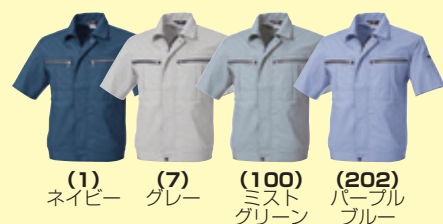
(1) ネイビー (7) グレー (100) ミストグリーン (202) パープルブルー

●271 半袖ブルゾン ¥10,300 (税込 ¥11,330) 素 材：綿 70%・ポリエステル 30% サイズ：M～4L・6L