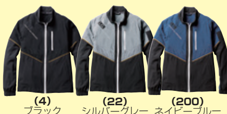
(4) ブラック (22) シルバークレー ネイビーブルー

●0368-00 長袖ブルゾン ¥9,000 (税込 ¥9,900) 素 材：ナイロン 90%・ポリエステル 10% サイズ：S～3L