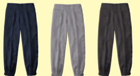
(1) ネイビー (22) シルバーグレー (86) ダークブラウン

64016 ベスト ¥6,800 (税込 ¥7,480) 素 材：ポリエステル 100% サイズ：M～4L