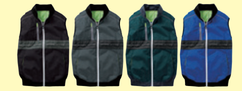
(4) ブラック (23) チャコールグレー (109) ダークグリーン (203) ロイヤルブルー