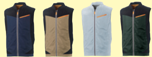
(1)ネイビー (3)ベージュ (22)シルバークレー (82)アーミー 配色/ブラック 配色/ブラック 配色/無し 配色/ブラック

■ファン取付孔の直径には個体差がございます。※ファン・バッテリー等は付いておりません。