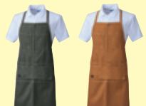
(82) アーミー (87) ライトブラウン

●10121 エプロン(首掛け) ¥4,500 (税込 ¥4,950) 素 材：綿 100% サイズ：フリー (腰 62cm 巾 × 裾 82cm 巾 × 85cm 丈)