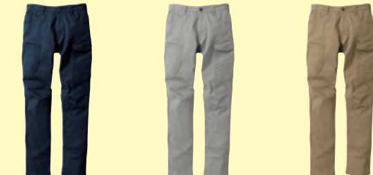
(1) ネイビー (7) グレー (87) ライトブラウン

2982-08 カーゴパンツ(ノータック) ¥5,000 (税込 ¥5,500) 素 材：綿 98%・ポリエステル 2% サイズ：70～130