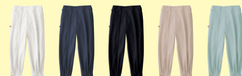
(0) ホワイト (1) ネイビー (4) ブラック (5) アイボリー (107) モスグリーン

1515 ニッカ(ワンタック) ¥3,400 (税込 ¥3,740) 素 材：ポリエステル 100% サイズ：76～95