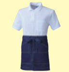
(557) ミッドインディゴ

●10130 ショートエプロン(腰巻き) ¥4,000 (税込 ¥4,400) 素 材：綿 100% サイズ：フリー (上 92cm 巾 × 下 90cm 巾 × 42cm 丈)