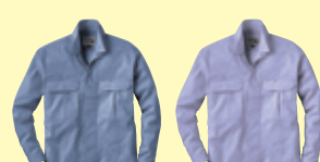
(21)ブルーグレー (60)ラベンダー

64019 細身超超ロングハ分 ¥7,800 (税込 ¥8,580) 素 材：ポリエステル 100% サイズ：S～4L