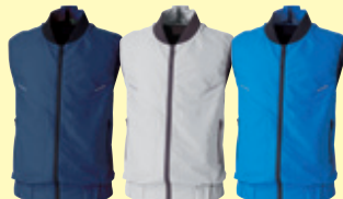
(1) ネイビー (22) シルバークレー (212) ライトブルー

❗ 3L以上は価格が変わります。(P3参照) ■ファン取付孔の直径には個体差がございます。※ファン・バッテリー等は付いておりません。