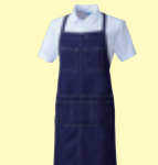
(557) ミッドインディゴ

●10131 エプロン(首掛け) ¥4,500 (税込 ¥4,950) 素 材：綿 100% サイズ：フリー (腰 62cm 巾 × 裾 82cm 巾 × 85cm 丈)