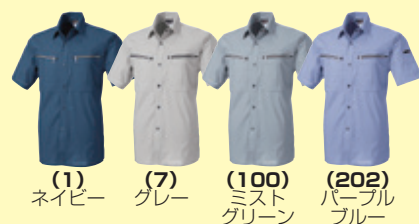
(1) ネイビー (7) グレー (100) ミストグリーン (202) パープルブルー

●277 半袖シャツ ¥8,900 (税込 ¥9,790) 素 材：綿 70%・ポリエステル 30% サイズ：M～4L・6L