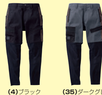
(4) ブラック (35) ダークグレー

●0188-07 ジョガーパンツ(ノータック) ¥8,700 (税込 ¥9,570) 素 材：ナイロン 90%・ポリエステル 10% サイズ：S～4L