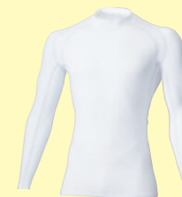
(0) ホワイト × シルバークレーライン

9700 つなぎ ¥12,000 (税込 ¥13,200) 素 材：ポリエステル 100% サイズ：M～LL