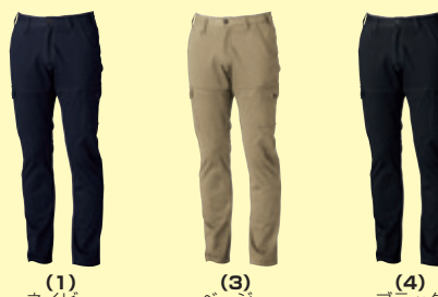
(1) ネイビー (3) ベージュ (4) ブラック

50093 長袖ブルゾン ¥18,000 (税込 ¥19,800) 素 材：綿 85%・ポリエステル 15% サイズ：S～3L