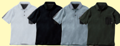
(0) ホワイト (4) ブラック (7) グレー (82) アーミー

●80046 マルチポケットベスト ¥2,700 (税込 ¥2,970) 素 材：ポリエステル 100% サイズ：XL (3L)