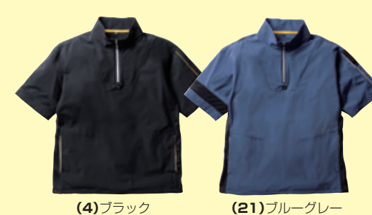
(4) ブラック (21) ブルーグレー

❗ 3L以上は価格が変わります。(P3参照) ポリエステル入り製品取扱上のご注意 (P2参照) 綿PU製品取扱上のご注意 (P2参照) ■製品洗い加工を施しているため、製品によって、色・サイズのパラつきがございます。