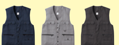
(1) ネイビー (22) シルバーグレー (86) ダークブラウン

2525 ニッカ(ワンタック) ¥6,400 (税込 ¥7,040) 素 材：綿 100% サイズ：73～100