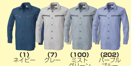
(1) ネイビー (7) グレー (100) ミストグリーン (202) パープルブルー

●273 長袖ブルゾン ¥10,400 (税込 ¥11,440) 素 材：綿 70%・ポリエステル 30% サイズ：M～4L・6L