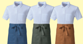
(8) ブルー (82) アーミー (87) ライトブラウン

●10120 ショートエプロン(腰巻き) ¥4,000 (税込 ¥4,400) 素 材：綿 100% サイズ：フリー (上 92cm 巾 × 下 90cm 巾 × 42cm 丈)