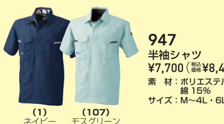
(1) ネイビー (107) モスグリーン

943 長袖ブルゾン ¥9,100 (税込 ¥10,010) 素 材：ポリエステル 85%・綿 15% サイズ：S～4L・6L