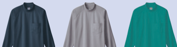
(7)グレー (22)シルバーグレー (205)ケンプリッチブルー

0058 長袖Tシャツ(ハイネック、胸ポケット有) ¥4,100 (税込 ¥4,510) 素 材：ポリエステル 55%・綿 45%(6.2oz 210g/㎡) サイズ：M～4L