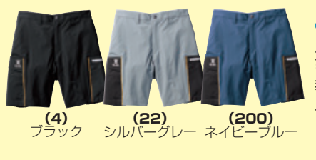
(4) ブラック (22) シルバークレー ネイビーブルー

●0368-08 ジョガーパンツ(ノータック、脇ゴム) ¥8,000 (税込 ¥8,800) 素 材：ナイロン 90%・ポリエステル 10% サイズ：S～4L