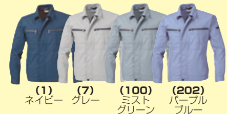
(1) ネイビー (7) グレー (100) ミストグリーン (202) パープルブルー

●271 半袖ブルゾン ¥10,300 (税込 ¥11,330) 素 材：綿 70%・ポリエステル 30% サイズ：M～4L・6L