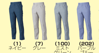
(1) ネイビー (7) グレー (100) ミストグリーン (202) パープルブルー

●278 カーゴパンツ(ツータック、脇ゴム) ¥9,200 (税込 ¥10,120) 素 材：綿 70%・ポリエステル 30% サイズ：S～4L・6L