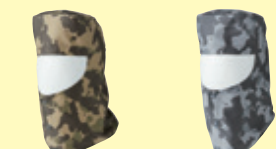
(510) カモフラグリーン (511) カモフラグレー

10093 溶接帽子 ¥2,300 (税込 ¥2,530) 素 材：綿 100% サイズ：M～LL