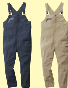
(1)ネイビー (3)ベージュ

オープンブライス 素 材:ポリエステル92%・ポリウレタン8% サイズ:S~4L