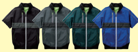
(4) ブラック (23) チャコールグレー (109) ダークグリーン (203) ロイヤルブルー

❗ 3L以上は価格が変わります。(P3参照) ■ファン取付孔の直径には個体差がございます。※ファン・バッテリー等は付いておりません。