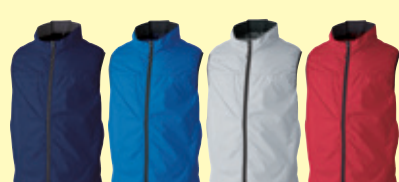
(1) ネイビー (8) ブルー (22) シルバークレー (43) レッド