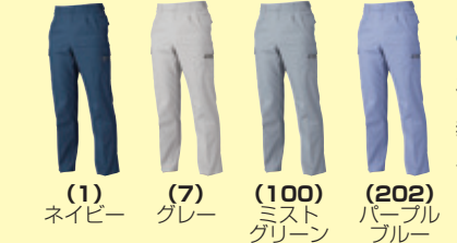
(1) ネイビー (7) グレー (100) ミストグリーン (202) パープルブルー

●277 半袖シャツ ¥8,900 (税込 ¥9,790) 素 材：綿 70%・ポリエステル 30% サイズ：M～4L・6L