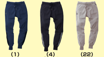
(1) ネイビー (4) ブラック (22) シルバークレー

●0188-08 カーゴパンツ(ノータック) ¥8,700 (税込 ¥9,570) 素 材：本体：ナイロン 90%・ポリエステル 10% 別布：ナイロン 80%・ポリエステル 20% サイズ：S～4L