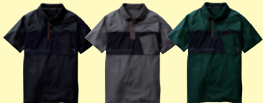
(4) ブラック (23) チャコールグレー (109) ダークグリーン

●7345-51 半袖ポロシャツ(胸ポケット有) ¥5,600 (税込 ¥6,160) 素 材：ポリエステル 90%・ ポリウレタン 10% (5oz 170g/㎡) サイズ：S～4L