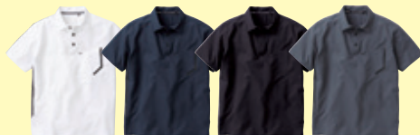
(0) ホワイト (1) ネイビー (4) ブラック (7) グレー

●7345-51 半袖ポロシャツ(胸ポケット有) ¥5,600 (税込 ¥6,160) 素 材：ポリエステル 90%・ ポリウレタン 10% (5oz 170g/㎡) サイズ：S～4L