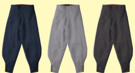
(1) ネイビー (22) シルバーグレー (86) ダークブラウン

64010 ニッカ(ワンタック) ¥6,800 (税込 ¥7,480) 素 材：ポリエステル 100% サイズ：73～105