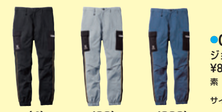
(4) ブラック (22) シルバークレー ネイビーブルー

●0368-00 長袖ブルゾン ¥9,000 (税込 ¥9,900) 素 材：ナイロン 90%・ポリエステル 10% サイズ：S～3L