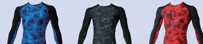
(8)ブルー (23)チャコールグレー (43)レッド

9900 つなぎ ¥7,900 (税込 ¥8,690) 素 材：ポリエステル 80%・綿 20% (目付量 180g/㎡) サイズ：SS～4L