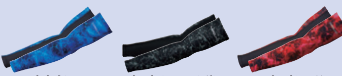
(8)ブルー (23)チャコールグレー (43)レッド

0085-40 長袖サポータシャツ ¥4,200 (税込 ¥4,620) 素 材：ナイロン 82%・ ポリウレタン 18% (5.6oz 190g/㎡) サイズ：GM・S～3L