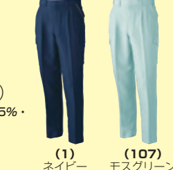
(1) ネイビー (107) モスグリーン

947 半袖シャツ ¥7,700 (税込 ¥8,470) 素 材：ポリエステル 85%・綿 15% サイズ：M～4L・6L