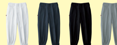
(0) ホワイト (1) ネイビー (4) ブラック (7) グレー

！ デニム製品取扱上のご注意 (P2参照) ■製品洗い加工を施しているため、製品によって、色・サイズのバラつきがございます