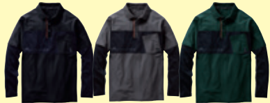
(4) ブラック (23) チャコールグレー (109) ダークグリーン

●7345-50 長袖ポロシャツ(胸ポケット有) ¥6,300 (税込 ¥6,930) 素 材：ポリエステル 90%・ ポリウレタン 10% (5oz 170g/㎡) サイズ：S～LL