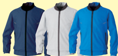
(1) ネイビー (22) シルバークレー (212) ライトブルー