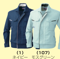
(1) ネイビー (107) モスグリーン

941 半袖ブルゾン ¥8,900 (税込 ¥9,790) 素 材：ポリエステル 85%・綿 15% サイズ：S～4L・6L