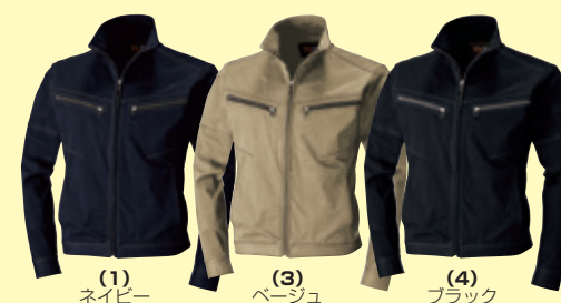
(1) ネイビー (3) ベージュ (4) ブラック

50093 長袖ブルゾン ¥18,000 (税込 ¥19,800) 素 材：綿 85%・ポリエステル 15% サイズ：S～3L