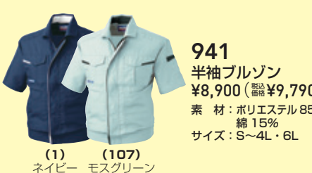
(1) ネイビー (107) モスグリーン

941 半袖ブルゾン ¥8,900 (税込 ¥9,790) 素 材：ポリエステル 85%・綿 15% サイズ：S～4L・6L