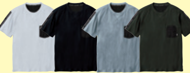
(0) ホワイト (4) ブラック (7) グレー (82) アーミー

0135-51 半袖ポロシャツ(胸ポケット有) ¥4,800 (税込 ¥5,280) 素 材：ポリエステル 50%・ポリプロピレン 50% (5.0oz 170g/㎡) サイズ：S～3L