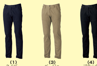
(1) ネイビー (3) ベージュ (4) ブラック

50098 カーゴパンツ(ノータック) ¥14,500 (税込 ¥15,950) 素 材：綿 85%・ポリエステル 15% サイズ：S～3L